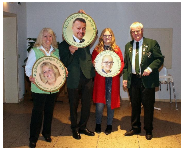
Foto 2019 Königsfeier